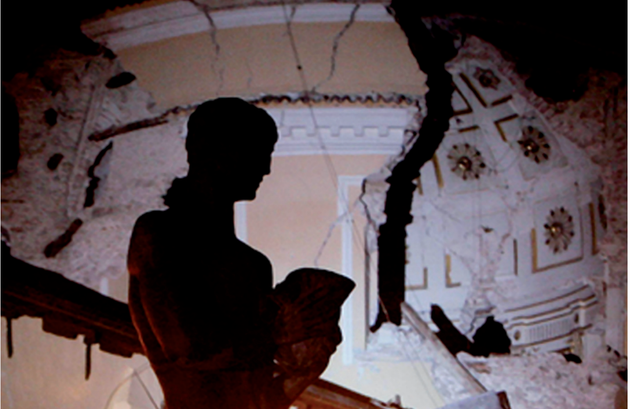
Cupola del Duomo a L'Aquila