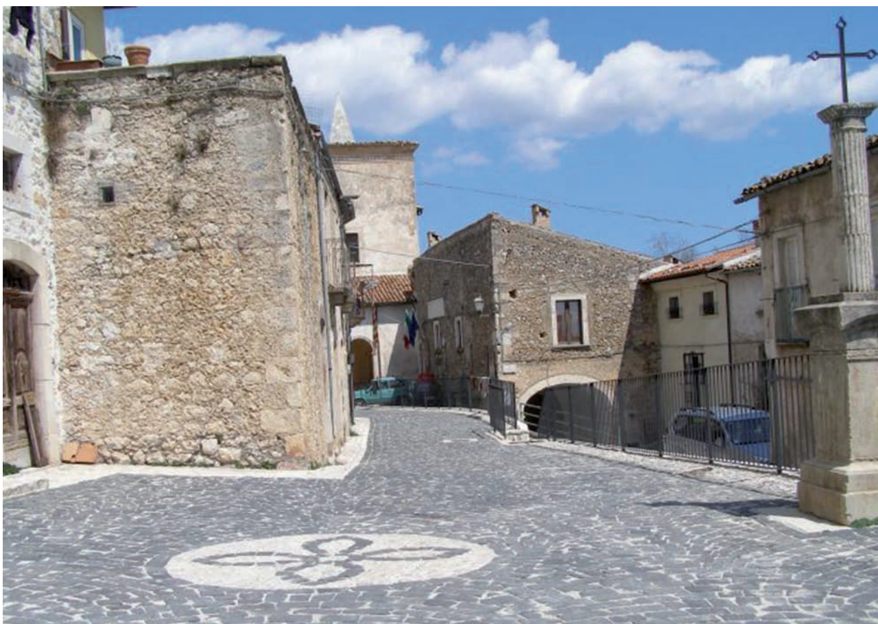
Santo Stefano di Sessanio

Attraversando spettrali rovine di chiese, di interi borghi, di edifici rurali ci si rende conto di come la tradizione architettonica abruzzese sia legata a un mondo pastorale e contadino che è tanto povero quanto vero. Nell'emergenza è necessario ristabilire un tetto agli sfollati, eventualmente anche ricostruire edifici anonimi, come periferie urbane. Ma negli anni che seguiranno bisogna evitare di ripetere l'errore che è stato compiuto nella valle del Belice, in Sicilia, in paesi come Salemi, dove io sono sindaco, Gibellina,