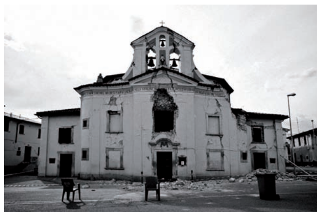
Paganica, chiesa della Concezione

Come è avvenuto per Santo Stefano è necessario utilizzare le nuove tecnologie per ricostruire e rendere sicure le vecchie abitazioni ed immaginare un ritorno degli sfollati in tutti i piccoli borghi abruzzesi senza lasciarli in abbandono e senza sfigurarli. L'edilizia minore, a Navelli, a San Pio delle Camere, a Tornimparte è così preziosa che richiede più attenzione e amore delle architetture monumentali. Per questo sarebbe fondamentale che il presidente del Consiglio e il sottosegretario Guido Bertolaso si avvalessero dell'e-