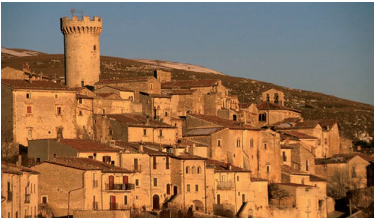
Veduta di Santo Stefano di Sessanio

Poggioreale o Santa Margherita di Belice. Qui necessità pratiche, deliri di architetti hanno imposto soluzioni irrazionali creando città fantasma.