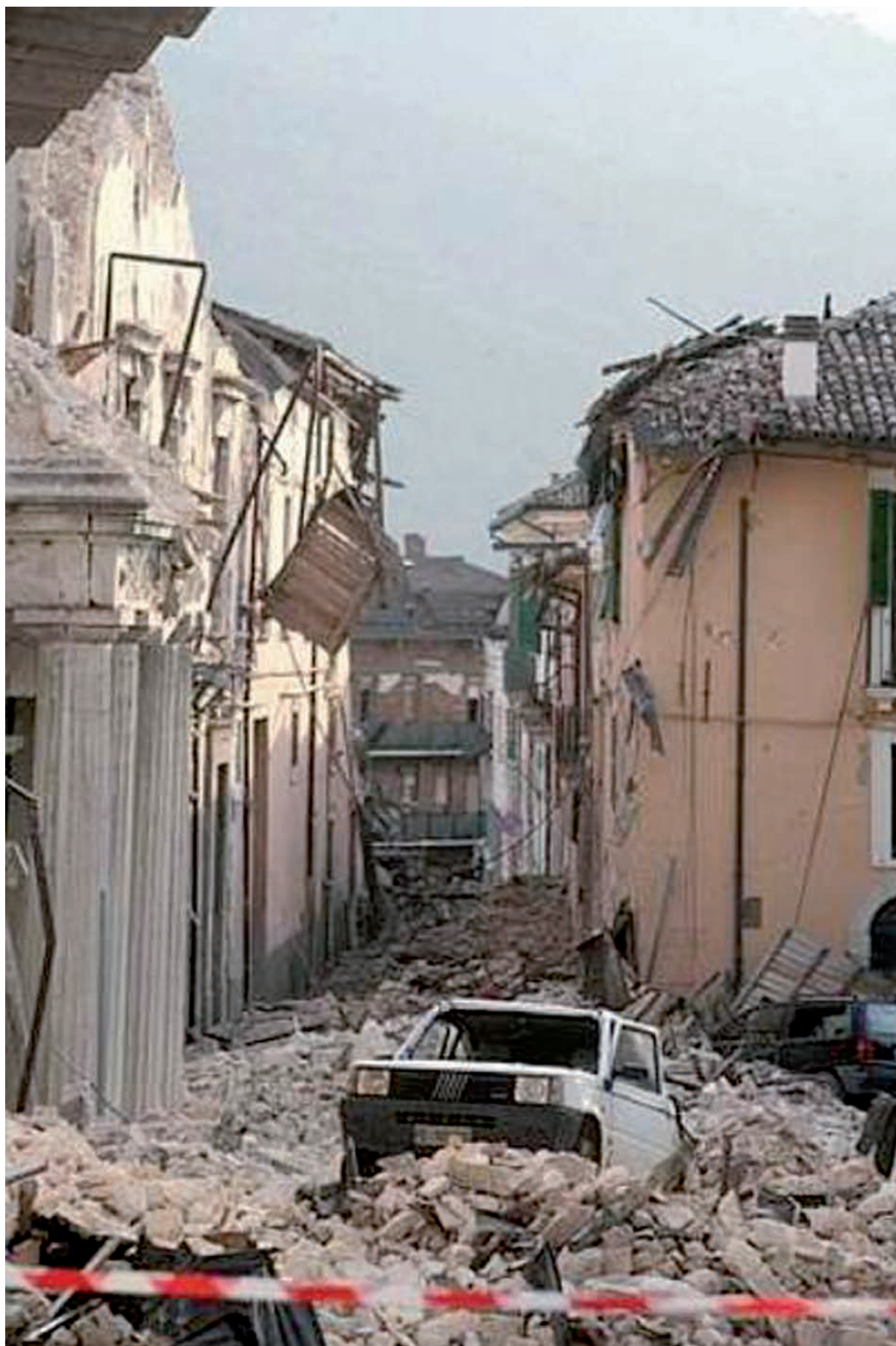
La strada della Prefettura a L'Aquila