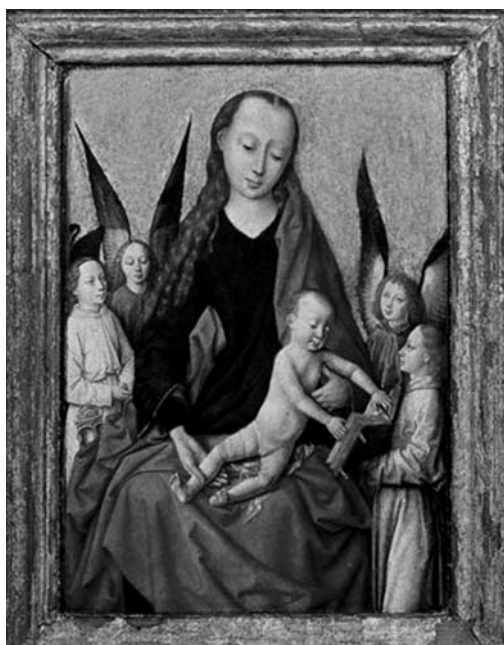
Ambito di Thierry Bouts Madonna col Bambino e angeli olio su tavola, cm 30x40 Trafugata in settembre 2009 a Firenze

*Rubrica realizzata in collaborazione con la Sezione Elaborazione Dati del Comando Carabinieri Tutela Patrimonio Culturale.