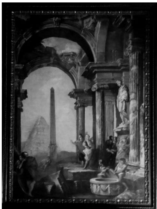
Giovanni Paolo Panini (1691-1765) Alessandro Magno visita la tomba di Achille olio su tela, cm 123x86 Trafugata il 30/08/2009 in abitazione privata, Roma