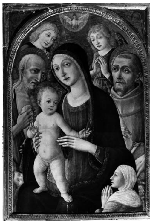
Guidoccio Cozzarelli (1450-1517) Madonna con Bambino, San Girolamo, San Francesco e donatore tavola fondo oro Trafugata l'11/10/2009 in abitazione privata, Firenze