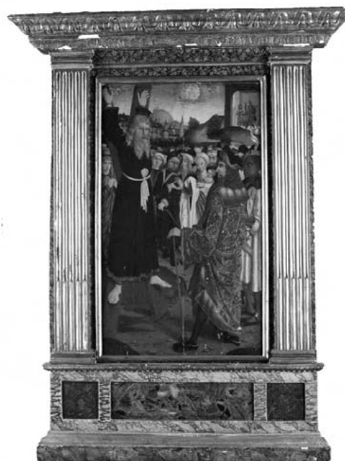
Anonimo del XV secolo Il Martirio di Sant'Andrea Olio su tavola, cm 60x55 Trafugato il 01/11/1971 da una abitazione privata di Roma Recuperato il 23/02/2012 in una abitazione privata di Roma