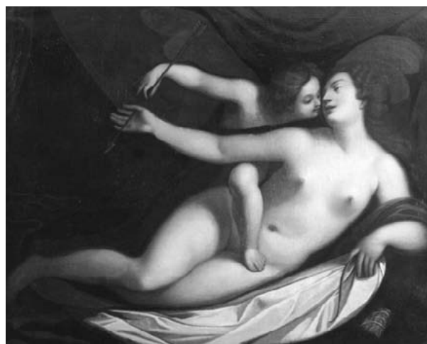
Giuseppe Meldolla detto "lo Schiavone"(1510-1563), attribuito Venere e Amore Olio su tela, cm 140 x113 Trafugato il 01/11/1971 da una abitazione privata di Roma Recuperato il 23/02/2012 in una abitazione privata di Roma