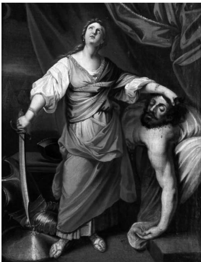
Guido Reni (1575-1642), attribuito Giuditta e Oloferne Olio su tela, cm 52x42 Trafugato il 01/11/1971 da una abitazione privata di Roma Recuperato il 23/02/2012 in una abitazione privata di Roma

*Rubrica realizzata in collaborazione con la Sezione Elaborazione Dati del Comando Carabinieri Tutela Patrimonio Culturale.