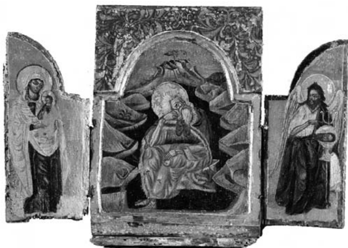
Anonimo del XV secolo Trittico Olio su tavola, cm 47x27 Trafugato il 01/11/1971 da una abitazione privata di Roma Recuperato il 23/02/2012 in una abitazione privata di Roma