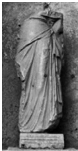
Statua di donna acefala

*Rubrica realizzata in collaborazione con la Sezione Elaborazione Dati del Comando Carabinieri Tutela Patrimonio Culturale.