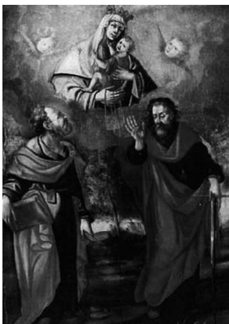
Pietro Paolo Sensini (1565 – 1630), scuola Madonna del Carmine con i santi Pietro e Paolo Olio su tela, cm 172 x 127 Trafugato il 23/02/2012 da chiesa privata di Caldarola (MC).