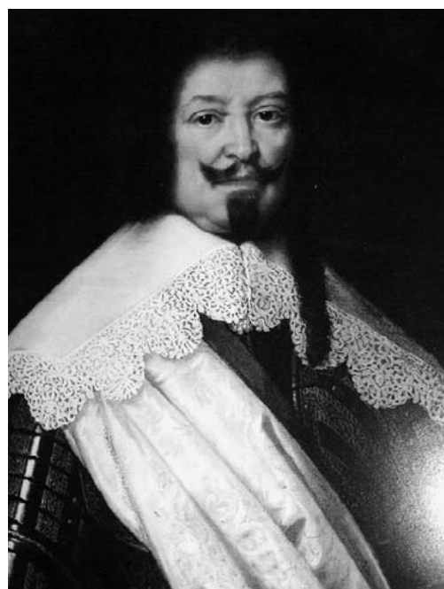
Anonimo del XVII sec. Ritratto di Carlo di Lorena Olio su tela, cm 70 x 50 Trafugato il 18/12/2009 da laboratorio di restauro di Roma.