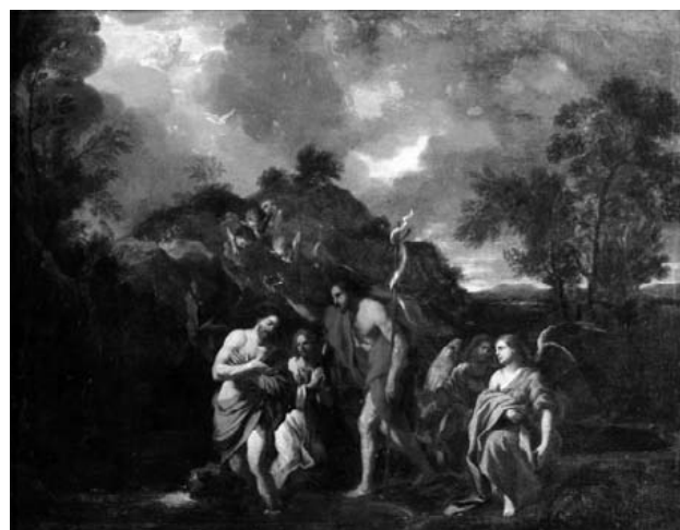
Nicolas Poussin (1594 –1662), attribuito Il battesimo di Gesù Olio su tela, cm 81x65 Trafugato il 01/11/1971 da una abitazione privata di Roma Recuperato il 23/02/2012 in una abitazione privata di Roma