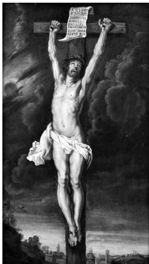
Pieter Paul Rubens (1577-1640), attribuito Gesù in croce Olio su tela, cm 47x27 Trafugato il 01/11/1971 da una abitazione privata di Roma Recuperato il 23/02/2012 in una abitazione privata di Roma