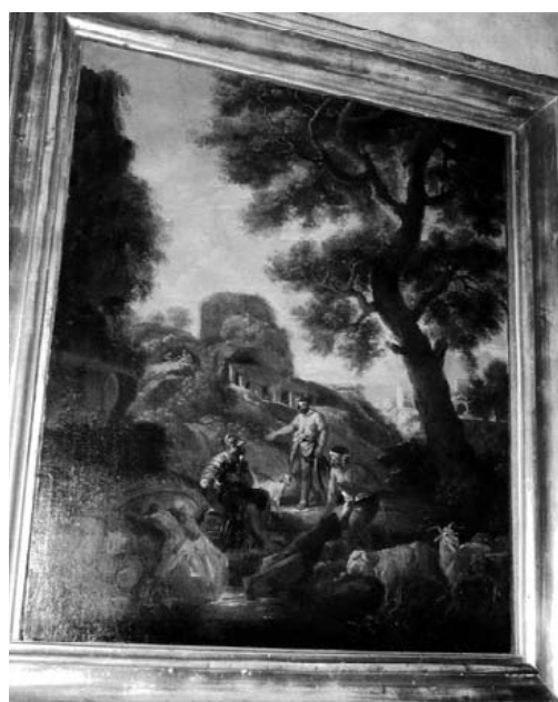
Andrea Locatelli (1695 – 1741), attribuito Paesaggio con figure e animali Olio su tela, cm 80 x 60 Trafugato il 18/12/2009 da laboratorio di restauro di Roma.

Un altro strumento per una conoscenza sempre aggiornata dei furti d'arte è il sito: www.interpol.int./Recent Thets/Property Crime/Works of Art . Qui si trovano riunite le notizie e le immagini delle opere trafugate comunicate all'Interpol a livello internazionale.